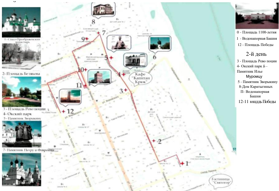
Рисунок 3 - Карта туристского маршрута «Загадки Старого Муром»